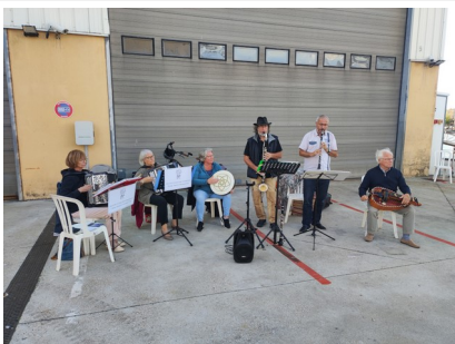
ambiance musicale avec le groupe des Machus du Havre