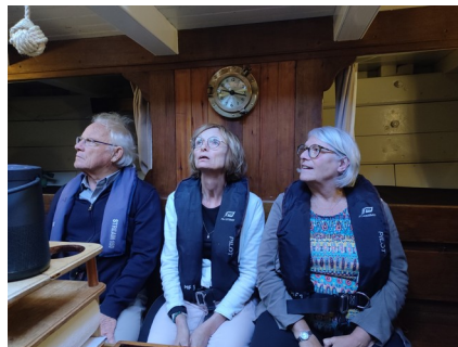
découverte du récit sur MF dans le carré du bateau