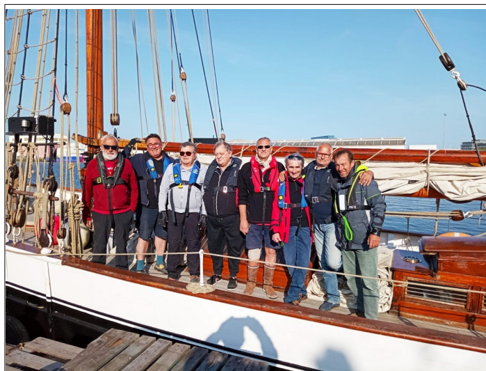
Équipage au départ

A notre grand regret, il faut rebrousser chemin et c'est une Hironnelle meurtrie qui rentre au nid.